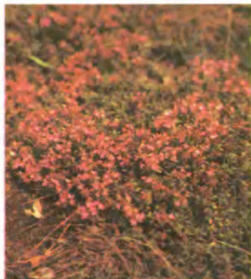
1029. Чебрець звичайний.